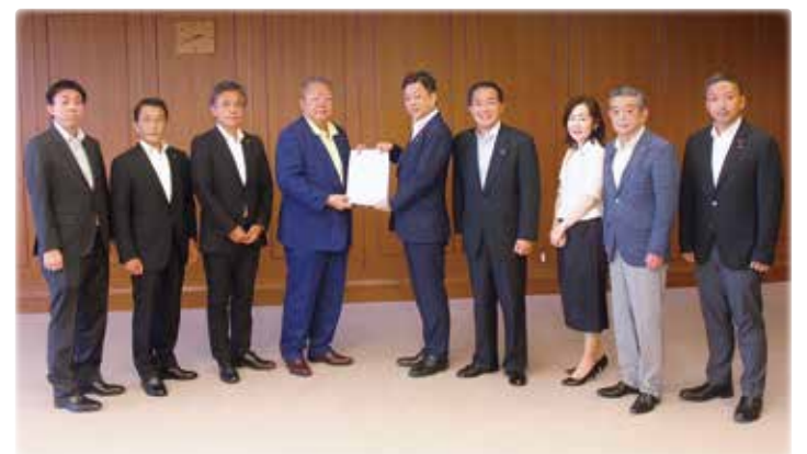
本年7月16日 会派として、防衛大臣政務官に要望書を提出