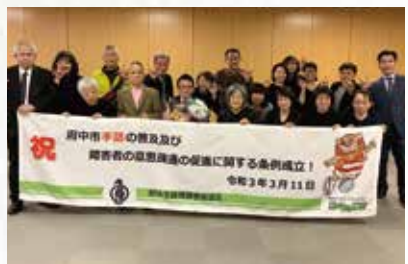
多摩26市で初めて「府中市手話の普及及び障害者の意思疎通の促進に関する条例」が制定

1歳を迎える子どもがいる 家庭にアンケートを実施、 返信家庭に1万円分のこ ども商品券の配布