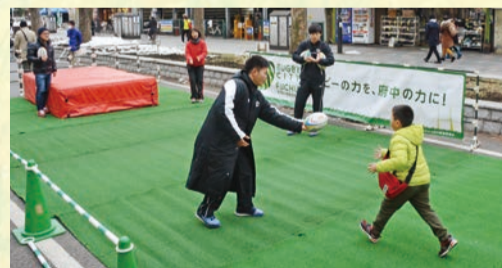
ラグビーワールドカップイベント