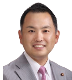
幹事長 白井 克寿議員