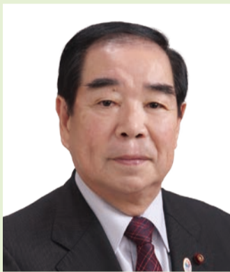
府中市議会議長 文教委員会／基地等跡地対策特別委員会 小野寺 淳 議員