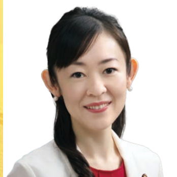
増山 明香 議員