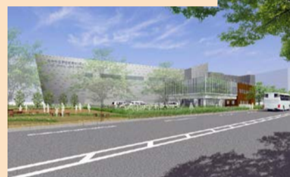
新学校給食センター

府中駅と府中本町駅の賑わいをつなぐ拠点となる新庁舎を実現します。(平成33年度完成予定)