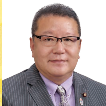
比留間 利蔵 議員