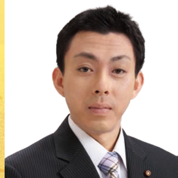
松村 祐樹 議員