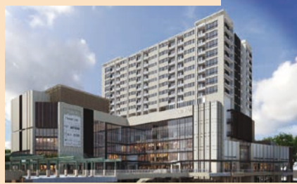
府中駅南口第一地区

JR線と京王線の結節点であり、府中市内で一番乗降客数が多く駅を含めその周辺のまちづくりを推進します。