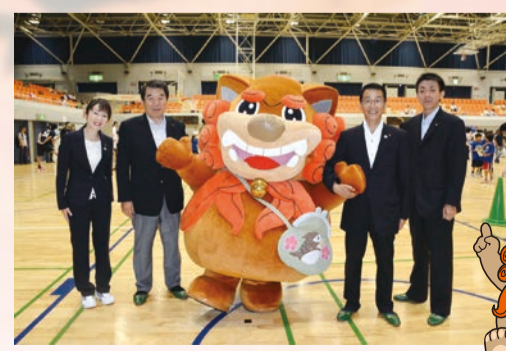
ボールふれあいフェスタ