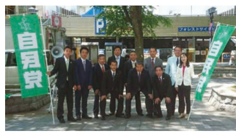
2015年5月フォーリス前での街頭演説