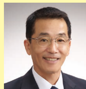
幹事長 市川かずのり 議員